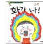
화가 나! (소담주니어/2013)